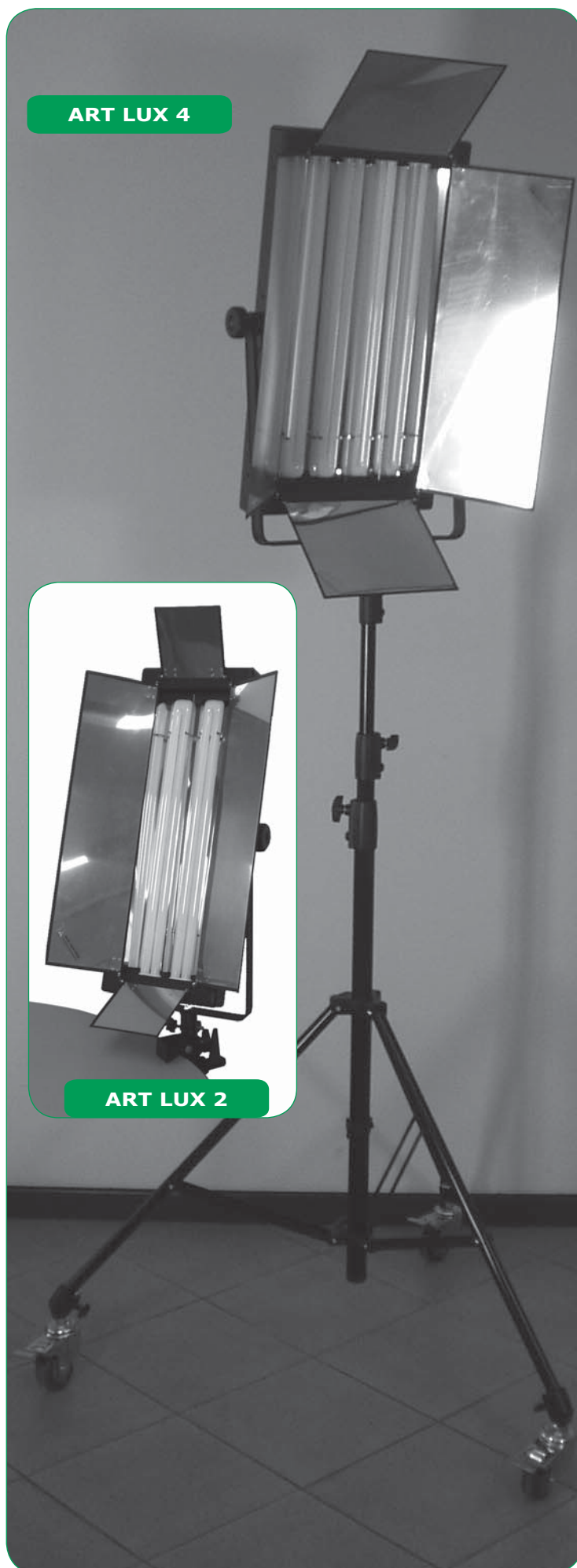
ART LUX 4